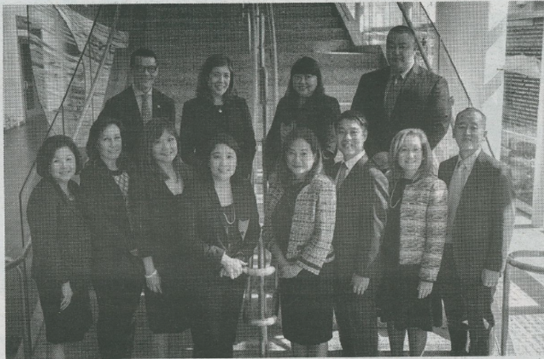
2018年度在米日系人リーダー訪日プログラム参加者（ロサンゼルスにおけるオリエンテーションにて）