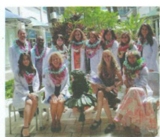
大学院在学中に行われた白衣授与式のとき。クラスの仲間たちとの記念の1枚

専門的な勉強が始まると、英語が難しく、授業についていくのがやっとでした。そんな中で、初めて解剖学を勉強したとき、人間の体の仕組みに感動し、医療への関心が一段と高まりました。勉強は大変でしたが、日本人がほとんどいない心細さもありました。が、人種に関係なく同じ志を持つ人たちが互いに助け合う大切さも学びながら、乗り越えることができました。